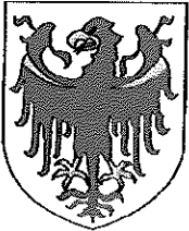
Provincia Autonoma di Bolzano Alto Adige Autonome Provinz Bozen Südtirol