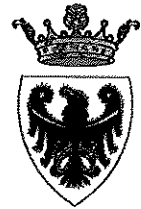
Provincia Autonoma di Trento